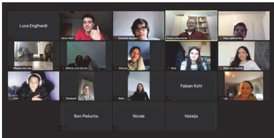
virtueller Konfiunterricht am 10.03.2021