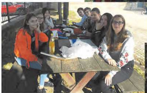
Unsere Konfis beim KonfiSamstag der Kulmregion zum Thema „Gebet“.