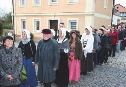
Einzug in die Kirche

Bis auf den letzten Platz gefüllte Kirche im Gottesdienst und beim Theaterstück