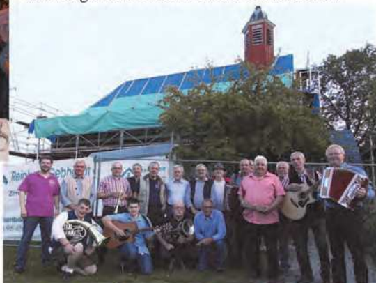
„Afgspuit im Gemeindehaus 2017“ Mehr als 25 Musikanten sorgten für gute Stimmung. Im Hintergrund der gute Zweck der Erlöse: unsere eingerüstete Michaelskirche.