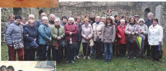
Der Ökumenische Ausflug von Pressath ging dieses Mal nach Wunsiedel zum Katharinenberg mit den Tafeln der Seligpreisung.