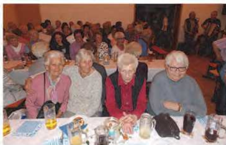
Der jüngste Gast war 14, die älteste 93. Unsere Kirchengemeinde verbindet alle Generationen.