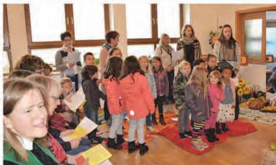
Kinderhaus im Gemeindehaus hieß es beim diesjährigen Erntedankfest.