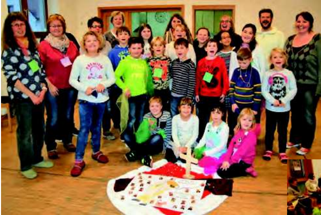
Kinderbibeltag 2016 – ein voller Erfolg!