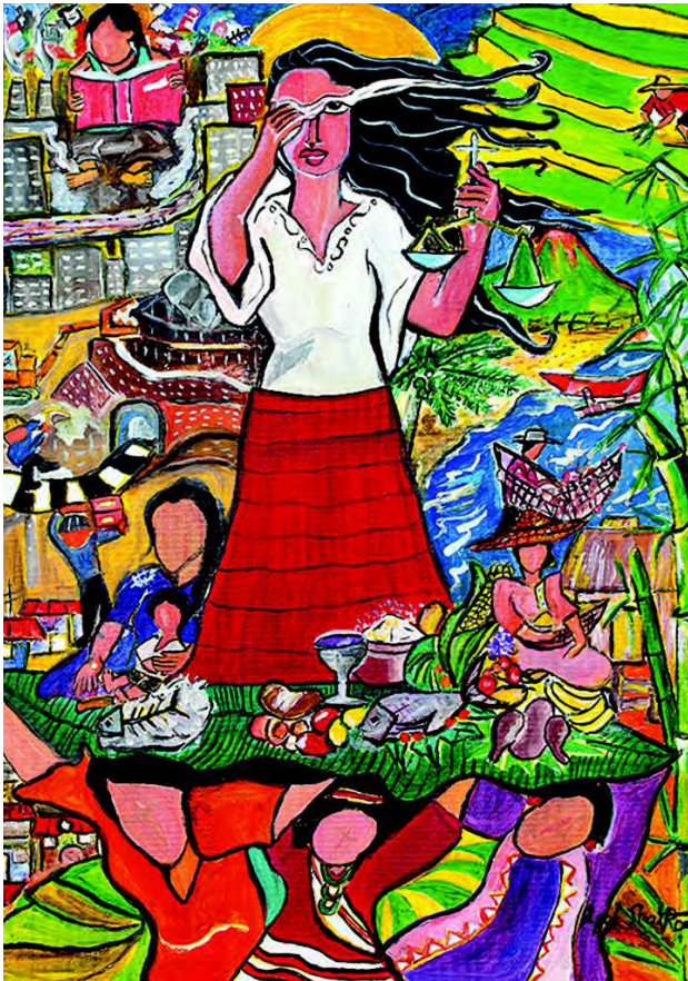
Das Bild zum diesjährigen Weltgebetstag von den Philippinen.

Wenn ihr in ein Haus kommt, so sagt als Erstes: Friede diesem Haus!