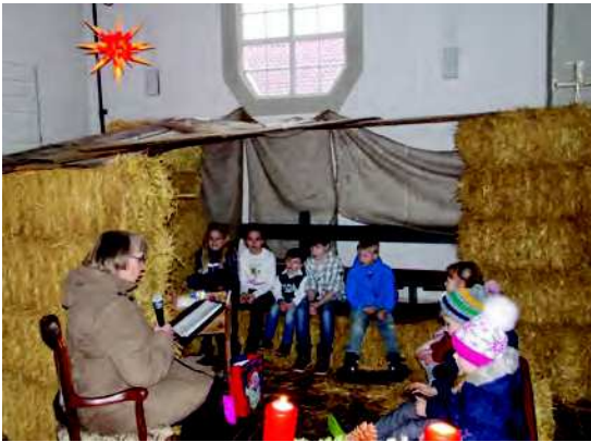
In der Michaelskirche konnten die Kinder beim Krippenspiel an Heiligabend in der lebensgroßen Krippe aus Stroh live dabei sein in Betlehem.