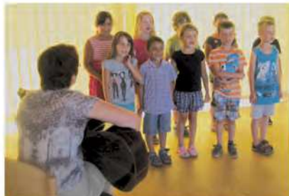
Der Geburtstagskaffee im Juli wurde wieder besucht von der Schulkindergruppe aus dem Kinderhaus Kunterbunt. Neue Geburtstagskinder sind immer herzlich willkommen!