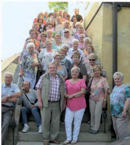
Der Seniorendienstagsclub beim Tagesausflug am 11. Juli im Glasdorf Arnbruck. Schön war's!