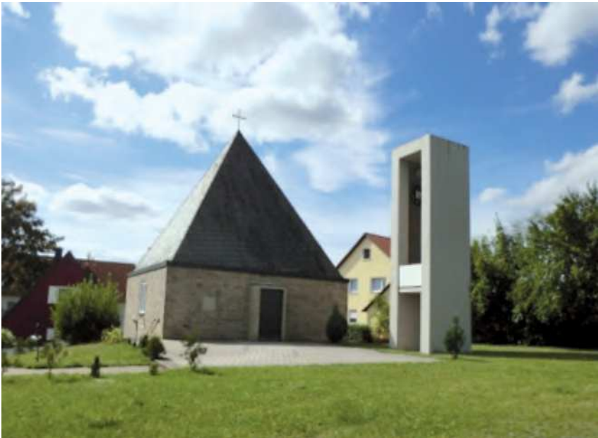
Johanneskirche in Kirchenthumbach

Grafenwöhr-Pressath & Eschenbach-Kirchenthumbach