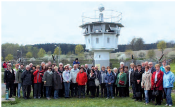
Ökumenischer Maiausflug nach Mödlareuth