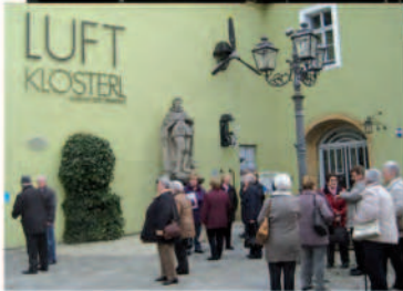
Der Senioren- dienstagsclub im April in Bayreuth...