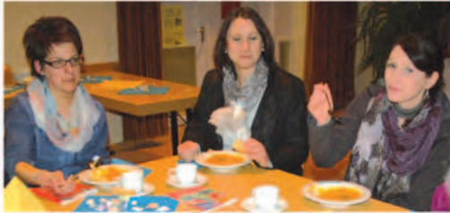
Weltgebetstag in Grafenwöhr