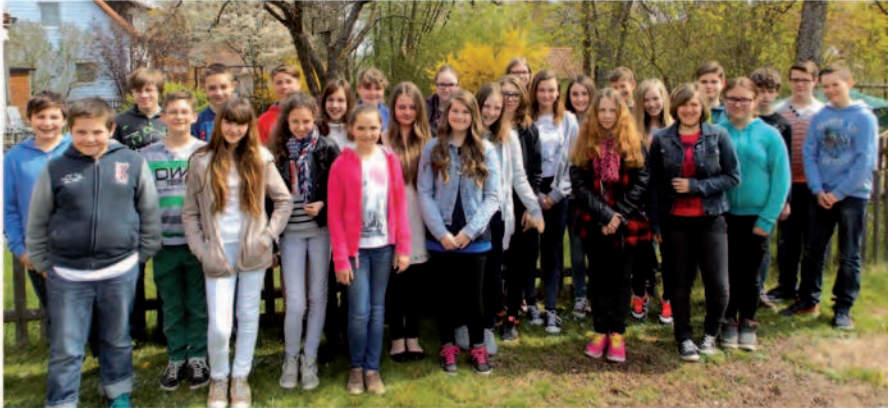
Wo kommen die denn alle plötzlich her?! – Na, aus Grafenwöhr, Pressath und Schwarzenbach! Hier sind unsere neuen Konfirmanden!

Verdiente Pause beim KonfiSamstag zum Thema Taufe: Bei 29 Konfis dauert die Reise nach Jerusalem etwas länger. ☺