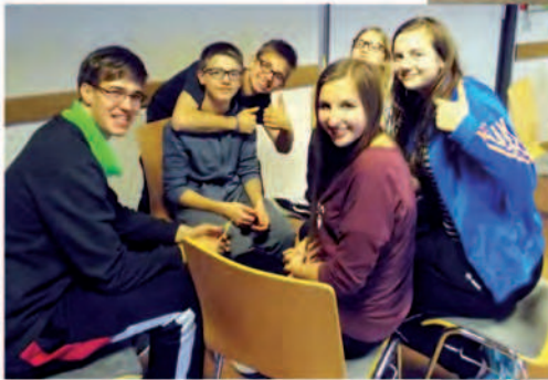
Die KonfiTeamer haben Alles fest im Griff.

Am ersten Maiwochenende ging es auf KonfiFreizeit ins Jugendhaus Speichersdorf (hinten im Bild). Neben der Arbeit am Thema Abendmahl kam auch die Freizeit nicht zu kurz.