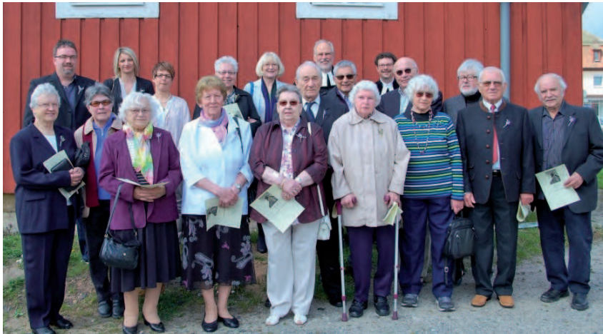
Lobe den Herrn, meine Seele, und vergiss nicht, was er dir Gutes getan hat! (Ps 103,2)