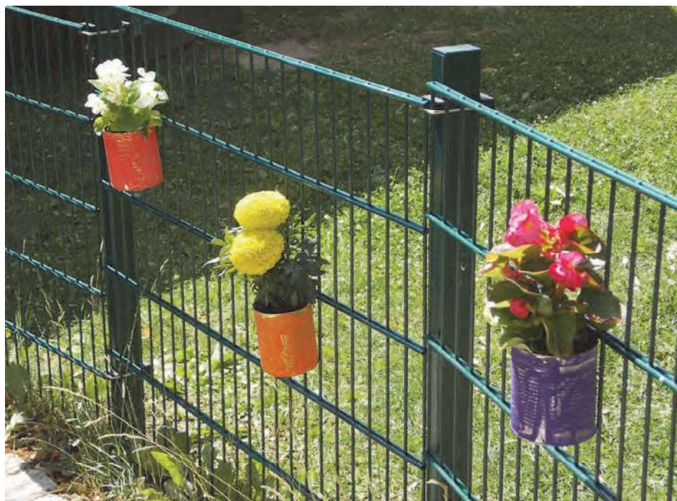
Gartenzaun der Kinderkrippe Grafenwöhr

Grafenwöhr-Pressath & Eschenbach-Kirchenthumbach