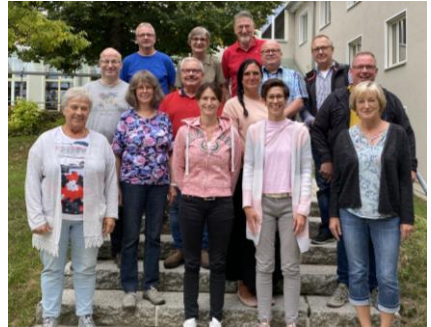
Die „Vierstädtedreieck“-KV's auf Klausur